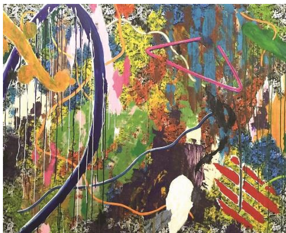
Garden of Image Table, 145,5 x 268 cm, akryl na tkanině, 2016

Youhei Kina – narozen 1979 v Tokiu, absolvoval Toyo Institute of Art & Design v Tokiu (2001-2004). Kromě autorských výstav v Japonsku vystavoval v roce 2007 v Muzeu současného umění v srbské Vojvodině a účastnil se výměnné česko-japonské výstavy Metaplay, Praha-Tokyo v roce 2014 a 2015. Žije a pracuje v Tokiu.